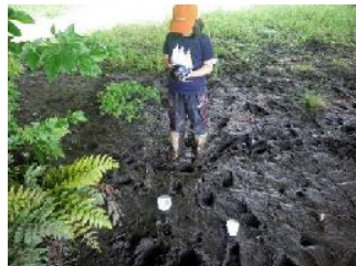
野生動物足跡石膏型とり