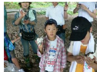
野生動物足跡石膏型とり