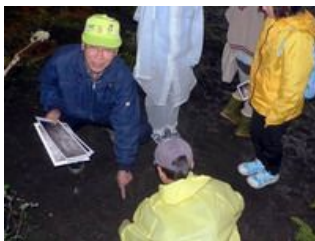
野生動物の足跡観察

名古屋・一宮方面からは国道21号から岐南 インターを越えそのまま北進、高架を通過して岩戸トンネルに入ります。トンネルを出てそのまま直進、信号機を過ぎてすぐ左へ鋭角的にまがります。高架に沿って山に向かって進み、高架下をくぐって100mほどで駐車場所(道路わき土の空き地)に着きます